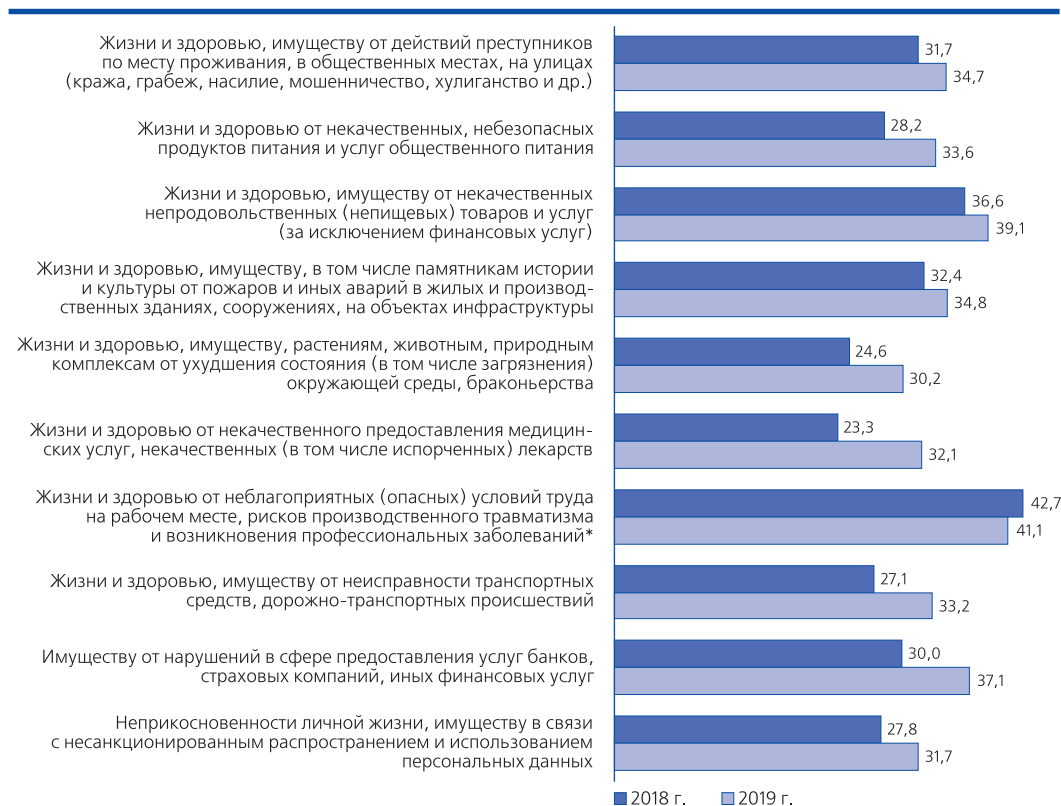
Рис. 1. Уровень защищенности значимых для граждан охраняемых законом ценностей от основных рисков (угроз) по результатам опросов 2018 и 2019 гг., в %

Результаты проведенных социологических исследований свидетельствуют о том, что в целом, несмотря на некоторую положительную тенденцию увеличения доли граждан, оценивающих уровень защищенности значимых для них ценностей с 30% в 2018 г. до 34,3% в 2019 г., большинство из них по-прежнему считают защищенность жизни, здоровья, имущества и иных исследуемых ценностей скорее низкой или очень низкой. Ни по одному из рисков, включенных в состав исследования, большинство респондентов не оценивают уровень своей защищенности как достаточный. При этом 56,7% опрошенных сталкивались за