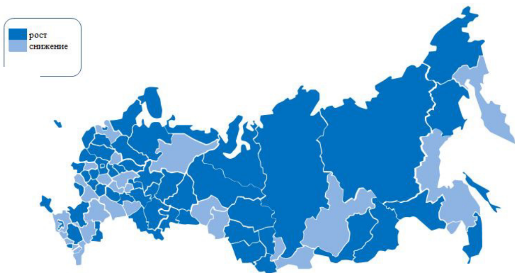
Рис. 3. Изменение коэффициента смертности населения от новообразований в разрезе регионов в январе–апреле 2018 г., в % к соответствующему периоду 2017 г.