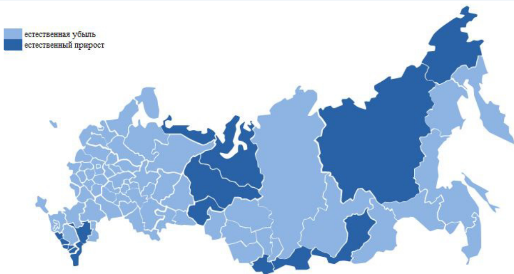
Рис. 2. Естественный прирост и естественная убыль населения в январе-апреле 2018 г.