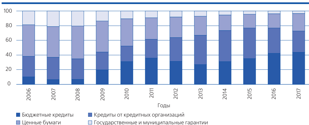
Рис. 3. Структура государственного долга субъектов РФ, в %