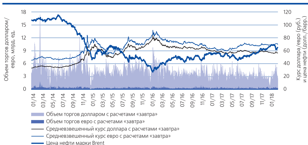
Рис. 2. Динамика биржевых курсов доллара и евро к рублю, объем торгов на валютном рынке, цена на нефть марки Brent

кредитной политики. Мы полагаем, что регулятор постепенно доведет ключевую ставку до нейтрального уровня в 6–7% на горизонте полутора-двух лет. ■