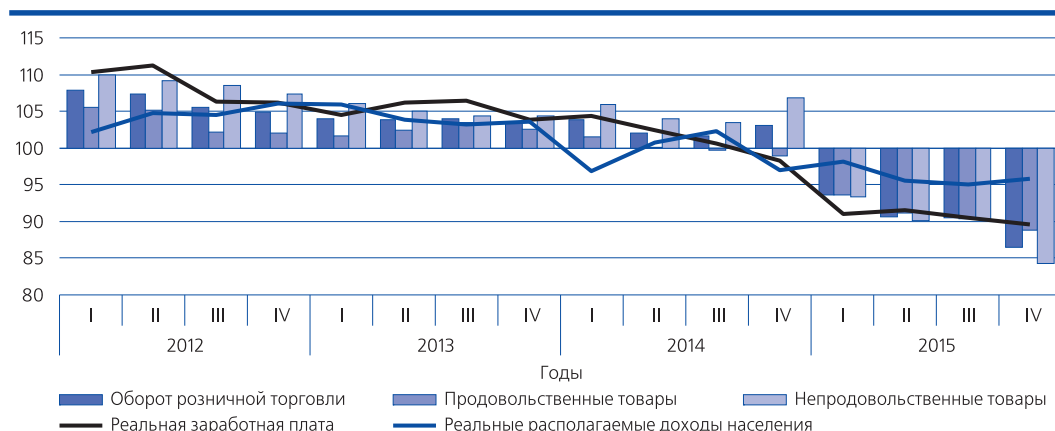
Рис. 2. Темпы роста реальных доходов населения, реальной заработной платы и оборота розничной торговли в 2012–2015 гг., в % к соответствующему кварталу предыдущего года

Падение доходов населения при сохранении высокой социально-экономической дифференциации и неравномерности в распреде-