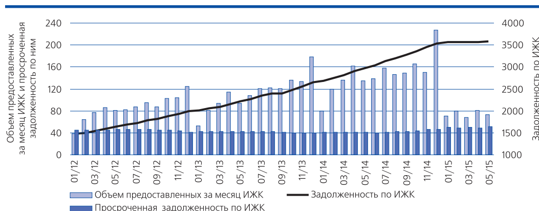
Рис. 1. Динамика предоставления ипотечных жилищных кредитов и задолженности по ним, млрд. руб.

По данным ЦБ РФ, объем предоставленных с начала года ИЖК в иностранной валюте (1,475 млрд. руб.) на 1 июня 2015 г. составил 0,4% от общего объема ИЖК, что на 0,1 п.п. меньше, чем на соответствующую дату 2014 г. Доля задолженности по ИЖК в иностранной валюте (112,942 млрд. руб.) в общей задолжен-