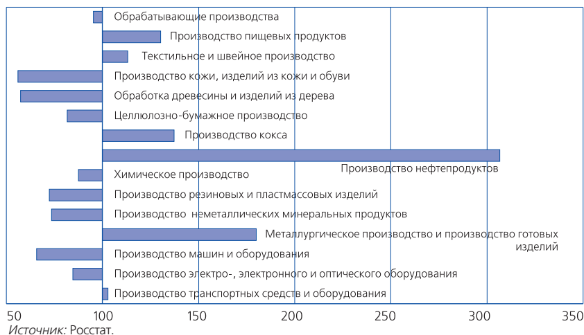
Рис. 2. Темпы роста инвестиций в основной капитал в обрабатывающих производствах в январе-сентябре 2013 г., в % к январю-сентябрю 2008 г.

шлин на мазут до уровня экспортной ставки на нефть. Согласно заключенным во второй половине 2011 г. и позднее скорректированным соглашениям нефтяных компаний с федеральными органами власти по модернизации производственных мощностей в 2012 г. были введены в эксплуатацию 10 установок неглубокой переработки сырья при плане 15 установок.