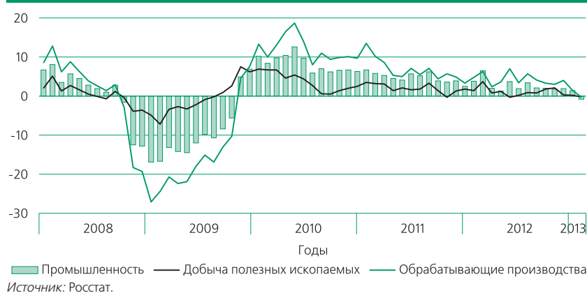
Динамика промышленного производства по видам экономической деятельности в 2008–2013 гг., в % к соответствующему периоду предыдущего года